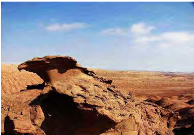
شکل؟؟) همای سعادت در کوه سرخ از توابع خراسان رضوی

فعالیت ۸: به این تصاویر دقت کنید: چه چیزی در آن توجه شما را به خود جلب می کند آیا می توانید با بهره گیری از این نمونه ها و یا با استفاده از مشاهدات طبیعی خود ، آفرینش خلاقانه ای داشته باشید