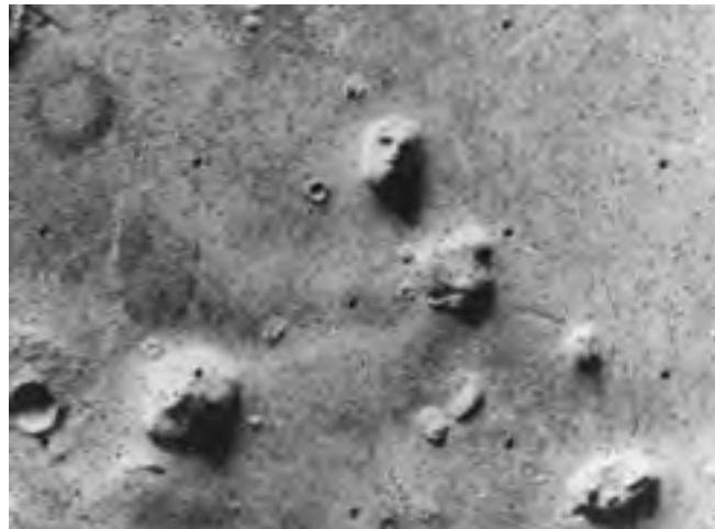
شکل (؟؟) وجود سایه روشن بر روی مریخ به صورت اتفاقی تصاویری را ایجاد کرده است.