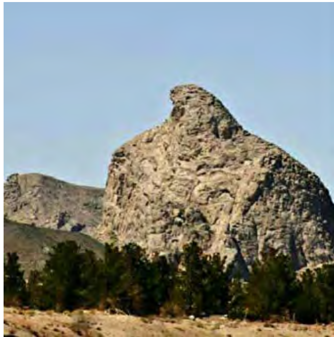
شکل (؟؟) عقاب کوه در شهرستان تفت در استان یزد